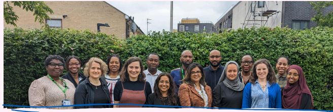
The Neurodevelopmental Team (El Equipo de Desarrollo Neurológico)