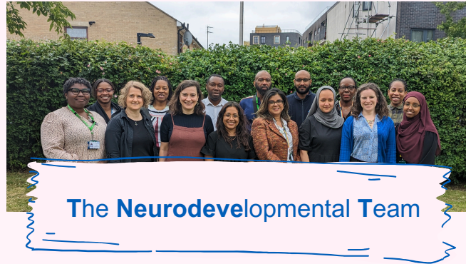
The Neurodevelopmental Team